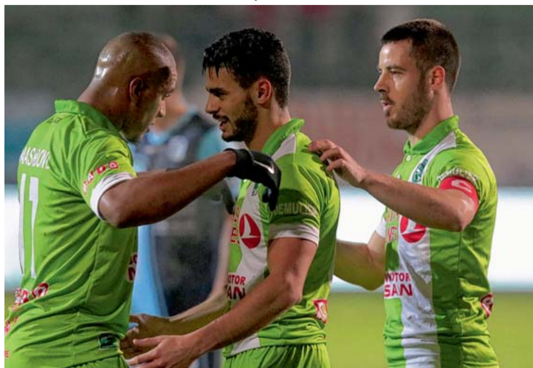
Sbaa avait donné l'avance à ses couleurs qui étaient sur le velours.

Balog scandalisé par le comportement de ses joueurs